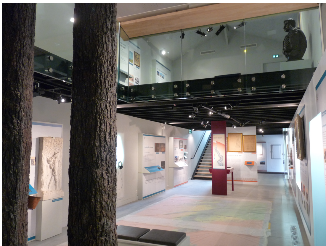
Aménagement intérieur de la Maison du Patrimoine

Le totem en métal coloré reprend les lettres décrivant ce site : MOP.