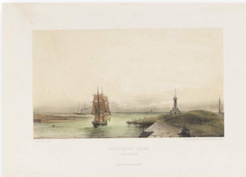
Barre de Bayonne. Entrée de l'Adour.